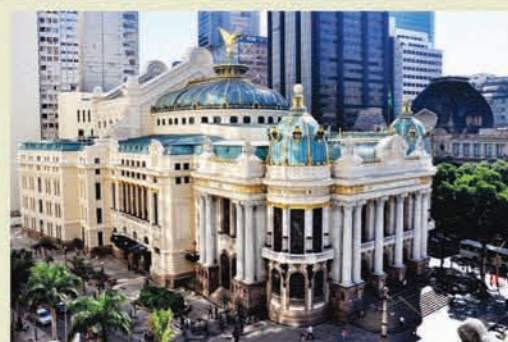
Theatro Municipal do Rio de Janeiro

Praça Floriano, s/n, Centro, Rio de Janeiro/RJ